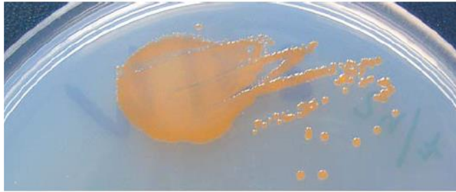
(Laura Gómez-Consarnau et al. Nature , 445 , 210–213, 2007)